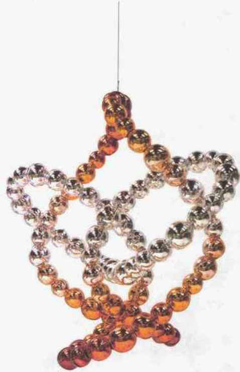
↓ Jean-Michel Othoniel, Gold Lotus , 2019 Inox, feuille d'or. 150 x 160 x 145 cm © 2021 Othoniel / ADAGP, Paris.