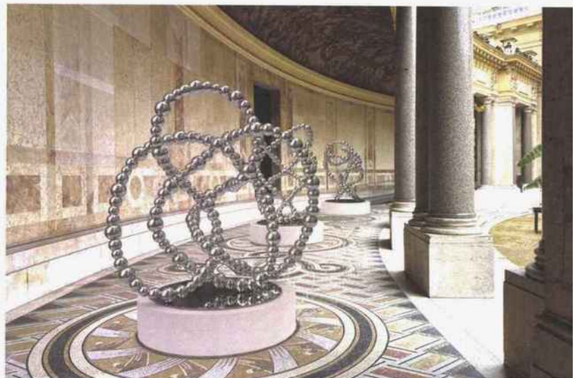
Jean-Michel Othoniel, Nœud Sauvage , 2019 Verre miroité, inox. 90 x 90 x 90 cm © 2021 Othoniel / ADAGP, Paris. →