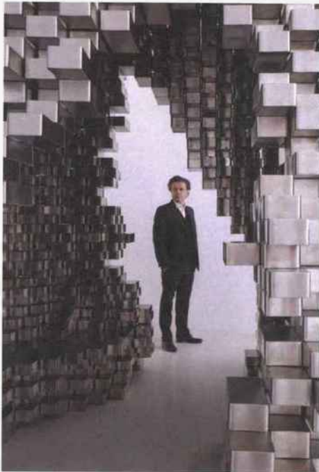
Jean-Michel Othoniel, Agora , 2019 Inox. 300 x 430 x 370 cm. 118 1/8 x 169 1/4 x 145 5/8 inch. © 2021 Othoniel / ADAGP, Paris. ↑