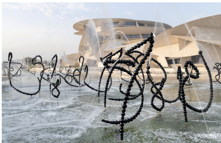
Jean-Michel Othoniel, Alfa, 2019, 114 sculptures fontaines; Installation permanente dans le lagon du National Museum of Qatar, Doha.