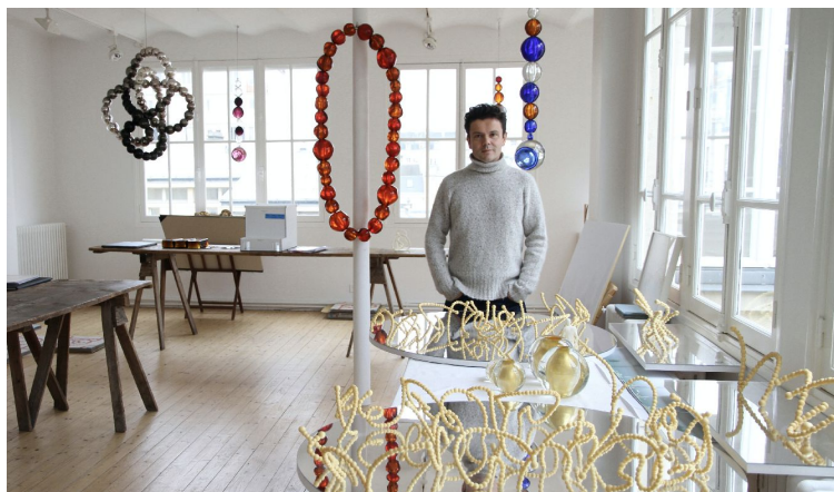
Jean-Michel Othoniel, Paris, 2014.

le Leeum Samsung Museum of Art/Plateau, à Séoul. En 2006, il est fait Chevalier de l'Ordre des Arts et des Lettres.