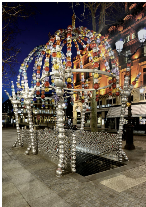
Le Kiosque des Noctambules, 2000. Station de métro Palais-Royal-Musée du Louvre, Place Colette, Paris.

Collection « Artistes contemporains » Publié par Phaidon 28 nov. 2019 Broché 45 € 200 photographies couleur 160 pages, 250 x 290 mm ISBN: 978 1 83866 005 5