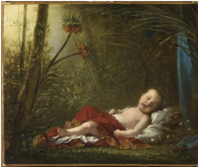
Pierre-Paul Prud'hon, Le roi de Rome , 1811

Franchissez la porte à votre gauche. Traversez la salle suivante 935. Empruntez les escaliers qui vous font face. Arrivé en salle 936, longez le mur à votre gauche. Au centre, vous trouverez la dernière œuvre de ce parcours.