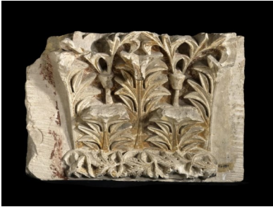
Chapiteau de pilastre, VI e siècle après JC

Depuis la Pyramide, dirigez-vous vers l'aile Denon. Après le contrôle, prenez à gauche vers les Antiquités Grecques. Traversez la salle 170. Devant le Torse de Milet , tournez à droite dans la salle 172. Au fond de celle-ci, à gauche de la porte, vous trouverez le chapiteau de pilastre.