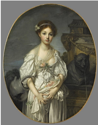
Jean-Baptiste Greuze, La Cruche cassée, 1771-1772 (env.)