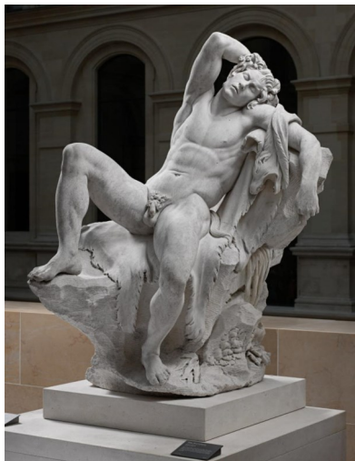
Bouchardon Edme, Faune endormi, 1726-1730

Depuis la Pyramide, dirigez-vous vers l'aile Richelieu. Après le contrôle, allez tout droit vers les salles de sculpture française. Arrivé en salle 104, tournez à droite pour atteindre la Cour Puget. Là, empruntez les trois escaliers à votre gauche pour atteindre le niveau supérieur de la cour.