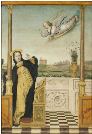
Carlo di Giovanni Braccesco, L'Annonciation , XV e siècle

Le long de ce même mur, à quelques mètres, vous trouverez le triptyque de Carlo Braccesco.