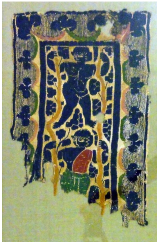
Fragment de tapisserie à décor de bacchanale, 395-641

Itinéraire jusqu'à la prochaine œuvre : L'étoffe byzantine est exposée dans la vitrine à votre gauche.