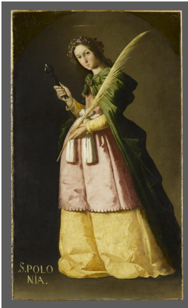
Francisco de Zurbarán, Sainte Apolline , XVII e siècle