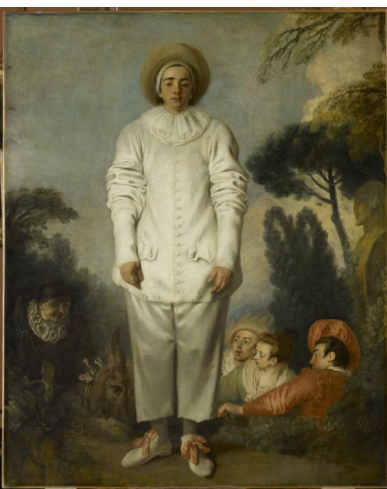
Jean-Antoine Watteau, Pierrot, 1700-1725

Au fond de la salle, montez l'escalier puis tournez à droite. Entrez dans la salle 917. Le tableau est face à vous.