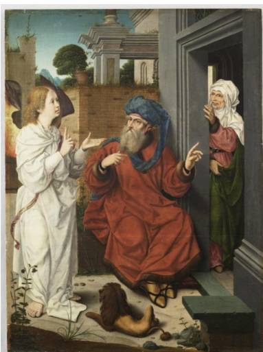
Jan Provost, L'Ange annonçant à Abraham la naissance d'un fils, XVI e siècle

Itinéraire jusqu'à la prochaine œuvre : Dirigez-vous vers la pièce suivante (817). Vous y trouverez le tableau de Jan Provost.