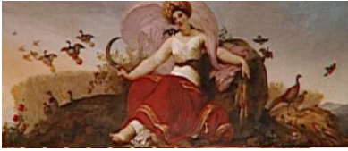
Jean-Baptiste Mauzaisse, L'automne, 2 e quart du XIX e siècle (1825-1850)