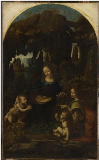
Léonard de Vinci, La Vierge aux rochers, 4 e quart du XV e siècle (1483-1499)