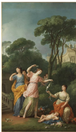
Joseph-Marie Vien, Jeunes grecques parant de fleurs l'Amour endormi , 1773

Itinéraire jusqu'à la prochaine œuvre : Avancez jusqu'à la salle suivante. Le tableau est accroché à votre droite en entrant.