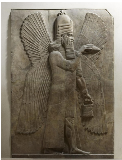
Orthostate, -721- -705 (env.)

Itinéraire jusqu'à la prochaine œuvre : Quittez la salle 223 et tournez directement à gauche. Traversez les salles 225 et 226. Au fond de la salle 227 se trouve une statue de lion en cuivre en provenance de Mari. Empruntez la porte à droite qui lui fait face, vous arriverez dans la salle 229. Continuez tout droit jusqu'à faire face à l'impressionnante Orthostate de Dur Sharrukin.