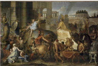
Charles Le Brun, Entrée d'Alexandre dans Babylone , 1665

Revenez sur vos pas jusqu'à la salle 914. Tournez le regard vers le mur de droite, vous y trouverez L'Entrée d'Alexandre dans Babylone de Charles Le Brun.