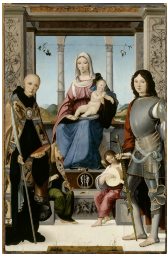
Francesco Marmitta, La Vierge et l'Enfant entourés de saint Benoit et saint Quentin et deux anges , 1 er quart du XVI e siècle

Le long de ce même mur, à quelques mètres, vous trouverez La Vierge et l'Enfant entourés de saint Benoit et saint Quentin et deux anges de Francesco Marmitta.