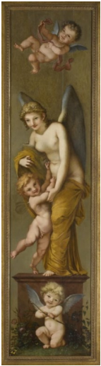
Pierre-Paul Prud'hon, Les Plaisirs , XIX e siècle