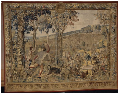
Bernard Van Orley, Le mois d'octobre ou Le signe du scorpion ou La curée de la tenture dite des Chasses de Maximilien, 1528-1533