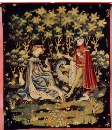
L'offrande du cœur, 1400-1410

Quittez la salle 508. Tournez à droite et continuez tout droit jusqu'à la salle 505. Là, tournez à gauche et entrez dans la salle vous faisant face. À l'entrée directement à votre droite, se trouve suspendue une dernière tapisserie, L'offrande du cœur .