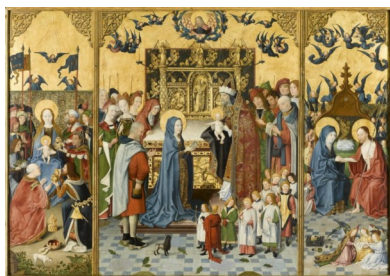
Maître de la Sainte Parenté, Retable des sept joies de la Vierge, 1470-1515

Il vous faut à présent rejoindre les escalators pour accéder au 2 e étage. Pour cela, continuez tout droit. Traversez le Grand salon (544), le Salon de Famille (543) et la salle dédiée à la collection Thiers. Tournez ensuite à droite et continuez jusqu'à sortir des appartements Napoléon III. Empruntez les escalators en direction du 2 e étage. Dirigez-vous vers l'entrée qui vous fait face (835) et traversez la pièce. Suivez la direction "Peintures. Ecoles du Nord". Vous voilà arrivé en salle 819. Le retable se trouve à votre droite.