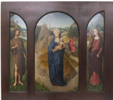
Hans Memling, La Fuite en Égypte , XV e siècle

Itinéraire jusqu'à la prochaine œuvre : Un peu plus loin, sur le même pan de mur vous trouverez La Fuite en Égypte d'Hans Memling.