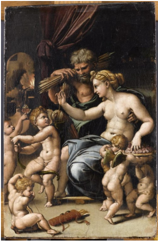
Atelier de Giulio Romano, Vénus, Vulcain et l'Amour avec cinq putti, 1 ère moitié du XVI e siècle (vers 1520-1530)