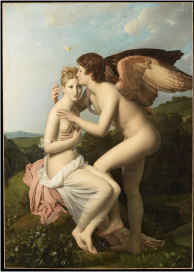
François Gérard, Psyché et l'Amour , dit aussi Psyché recevant le premier baiser de l'Amour , 1 ère moitié du XIX e siècle