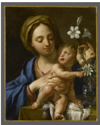
Francesco Trevisani, L'Enfant Jésus désignant à la Vierge les fleurs de la Passion, XVIII e siècle

Poursuivez jusqu'au bout de la Grande Galerie. Traversez la salle 717 puis descendez le petit escalier. Arrivé en salle 718, entrez dans le corridor de droite. L'Enfant Jésus désignant à la Vierge les fleurs de la Passion de Francesco Trevisani se trouve dans la première pièce du corridor (722).