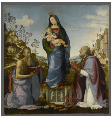
Mariotto Albertinelli, Saint Jérôme et saint Zénobe adorant l'enfant Jésus dans les bras de la Vierge , 1 er quart du XVI e siècle (1506) © 2009 RMN-Grand Palais (musée du Louvre) / Stéphane Maréchal

Itinéraire jusqu'à la prochaine œuvre : Tournez le dos à l'œuvre. Vous devez apercevoir l'accès vers la salle où est exposée la Joconde. À la droite de cette porte se trouve Saint Jérôme et saint Zénobe adorant l'enfant Jésus dans les bras de la Vierge de Mariotto Albertinelli.