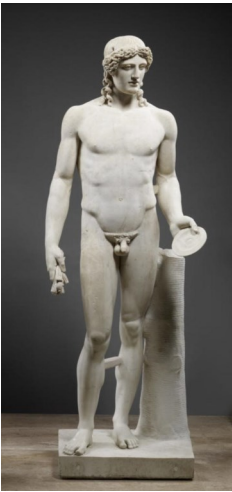
Apollon dit Bonus Eventus

Depuis la Pyramide, dirigez-vous vers l'aile Sully. Avant le Pavillon de l'Horloge, prenez l'escalier de droite afin de monter au rez-de-chaussée. Tournez à droite dans la salle 348 et avancez vers le fond de la salle afin de trouver la statue d' Apollon, dit Bonus Eventus sur la droite.