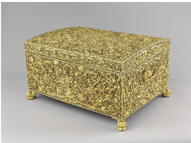
Blanck Jakob, Coffre des pierreries de Louis XIV , 1675

Itinéraire jusqu'à la prochaine œuvre : Revenez ensuite vers les escaliers pour monter au 1 er étage. Arrivé en haut, prenez à gauche jusqu'à la salle 601. Le coffre trône au centre de la pièce.