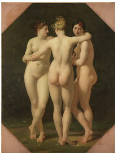
Jean Baptiste Regnault, Les trois Grâces, 1793-1794

Itinéraire jusqu'à la prochaine œuvre : Dans la salle suivante, Les trois Grâces sont en face de vous, à gauche de la porte.