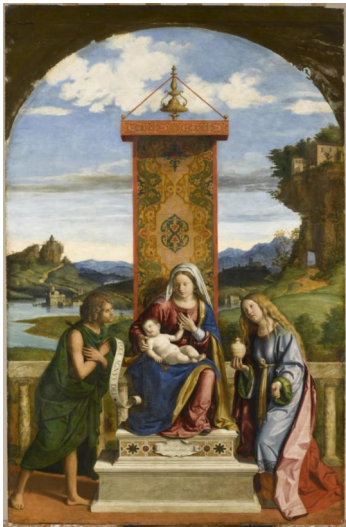
Cima da Conegliano, Giovanni Battista, La Vierge et l'Enfant entre saint Jean Baptiste et sainte Marie-Madeleine , 1 er quart du XVI e siècle

Itinéraire jusqu'à la prochaine œuvre : Le long de ce même mur, à quelques mètres, vous trouverez La Vierge et l'Enfant entre saint Jean Baptiste et sainte Marie-Madeleine de Cima da Conegliano et Giovanni Battista.