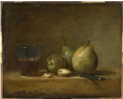
Jean Baptiste Siméon Chardin, Poires, noix et verre de vin , 1768 (env.)

Itinéraire jusqu'à la prochaine œuvre : Continuez tout droit jusqu'à la salle 928. L'œuvre suivante se trouve à droite de l'entrée.