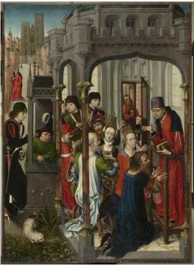
Maître de la vie de sainte Gudule, L'instruction pastorale , XV e siècle