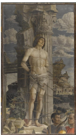
Andrea Mantegna, Saint Sébastien , 4 e quart du XV e siècle

Dirigez-vous vers la Grande Galerie (710). Sur le mur de gauche se trouve le Saint Sébastien d'Andrea Mantegna.