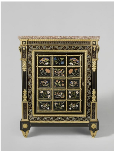
Gaspard Joseph Baumhauer, Cabinet bas , 1770 (env.)

Itinéraire jusqu'à la prochaine œuvre : Avancez jusqu'à l'escalier et montez au 2 e étage. Prenez à droite pour rejoindre la salle 911.