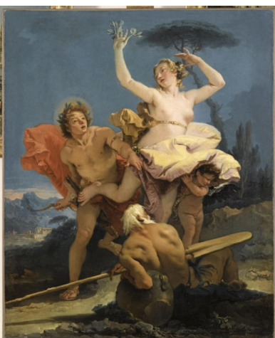
Tiepolo Giambattista, Apollon et Daphné , 2 e quart du XVIII e siècle (1741)

Continuez tout droit jusqu'à la dernière salle (725) où vous trouverez l'Apollon et Daphné de Tiepolo Giambattista.