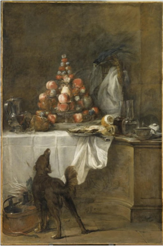
Jean Baptiste Siméon Chardin, Le Buffet , 1728