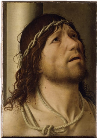
Antonello de Messine, Le Christ à la colonne , XV e siècle