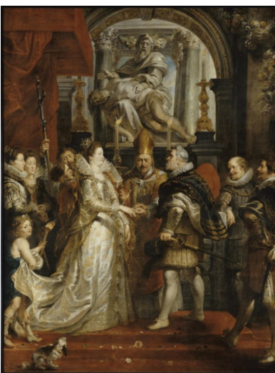
Petrus Paulus Rubens, Les Épousailles de la reine ou La Réception de l'anneau, dit encore Le Mariage par procuration de Marie de Médicis et de Henri IV, à Florence, le 5 octobre 1600, 1 er quart du XVIIe siècle (1600-1625)

Tournez le dos à l'œuvre. Dirigez-vous à droite. Continuez tout droit jusqu'à arriver en salle 802. Avancez jusqu'au milieu de la pièce puis tournez à droite. Parvenu en salle 801, dirigez-vous vers le mur à votre droite pour apercevoir Le Mariage par procuration de Marie de Médicis et de Henri IV de Rubens.