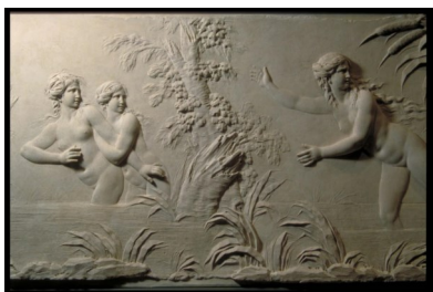
Michel Claude dit Clodion, Pan poursuivant Syrinx sous le regard de l'Amour, 1782

Itinéraire jusqu'à la prochaine œuvre : Tournez le dos au Faune endormi et empruntez le petit escalier à votre gauche. Dirigez-vous vers la salle 223 qui vous fait face. Le bas-relief de Clodion se trouve sur votre gauche.