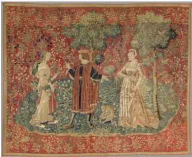
Scène allégorique, 1400-1435

Tournez le dos à la tapisserie et dirigez-vous à gauche jusqu'à la salle suivante (506). Arrivé à l'entrée, pénétrez dans la pièce à votre droite (508). Vous y trouverez une tapisserie aux couleurs chatoyantes intitulée Scène allégorique .