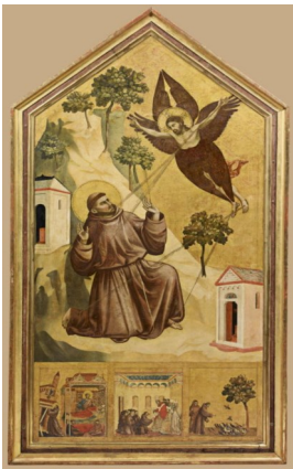
Giotto di Bondone, Saint François d'Assise recevant les stigmates, dans la prédelle: Saint François prêchant aux oiseaux, 1 er quart du XIV e siècle (1300-1325)

Revenez sur vos pas. Passez devant la Victoire de Samothrace et entrez dans la salle qui vous fait face (706). Continuez jusqu'à la salle 708. Le tableau se trouve à gauche de l'entrée.