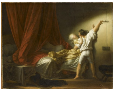
Jean-Honoré Fragonard, Le Verrou, 1777-1778 (env.)

Itinéraire jusqu'à la prochaine œuvre : Continuez dans la salle suivante. Retournez-vous, Le Verrou se situe à côté de la porte que vous venez d'emprunter.