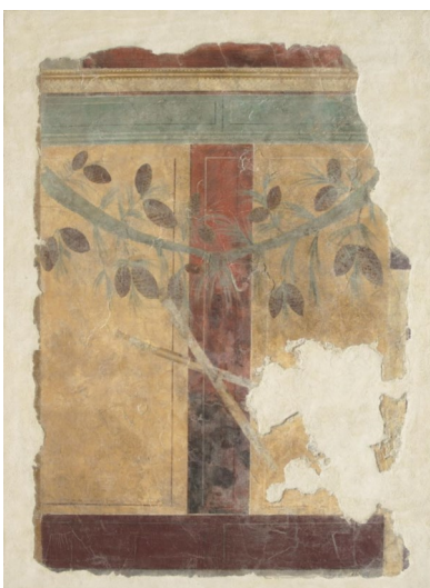
Peinture murale, villa de Fannius Synistor (Boscoreale), près de Pompéi, -50 - -40

Itinéraire jusqu'à la prochaine œuvre : Retournez sur vos pas. Arrivé au Torse de Milet , empruntez les escaliers qui mènent au rez-de-chaussée. Arrivé en haut (407), dirigez-vous vers la pièce suivante (409) au fond à droite. En entrant, tout de suite à votre gauche vous trouverez la peinture murale de Fannius Synistor.