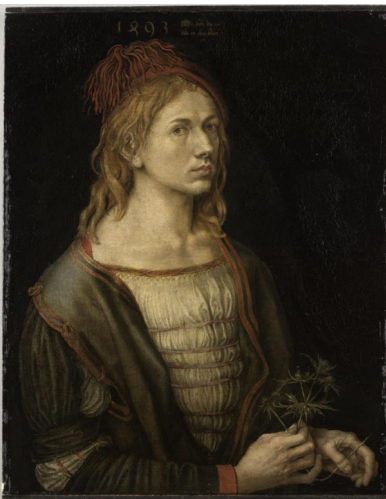
Albrecht Dürer, Portrait de l'artiste tenant un chardon, 4e quart du XVe siècle (1493)

Contournez le pan de mur face auquel vous vous trouvez. Traversez la salle 811 sans vous arrêter. Dans la salle suivante (809), vous trouverez le Portrait de l'artiste tenant un chardon d'Albrecht Dürer à votre droite.