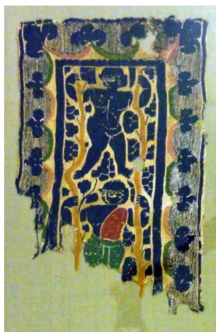
Fragment de tapisserie à décor de bacchanale, 395-641

Itinéraire jusqu'à la prochaine œuvre : L'étoffe byzantine est exposée dans la vitrine à votre gauche.