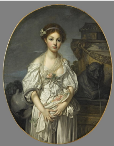
Jean-Baptiste Greuze, La Cruche cassée, 1771-1772 (env.)