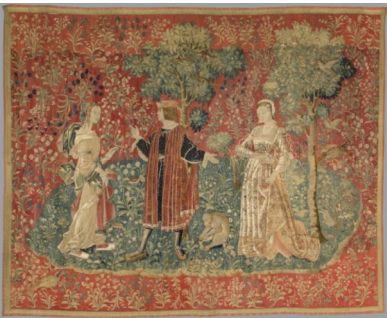
Scène allégorique, 1400-1435

Tournez le dos à la tapisserie et dirigez-vous à gauche jusqu'à la salle suivante (506). Arrivé à l'entrée, pénétrez dans la pièce à votre droite (508). Vous y trouverez une tapisserie aux couleurs chatoyantes intitulée Scène allégorique .