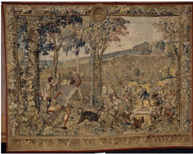
Bernard Van Orley, Le mois d'octobre ou Le signe du scorpion ou La curée de la tenture dite des Chasses de Maximilien, 1528-1533