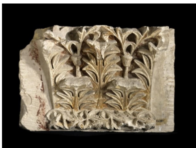
Chapiteau de pilastre, VI e siècle après JC

Depuis la Pyramide, dirigez-vous vers l'aile Denon. Après le contrôle, prenez à gauche vers les Antiquités Grecques. Traversez la salle 170. Devant le Torse de Milet , tournez à droite dans la salle 172. Au fond de celle-ci, à gauche de la porte, vous trouverez le chapiteau de pilastre.