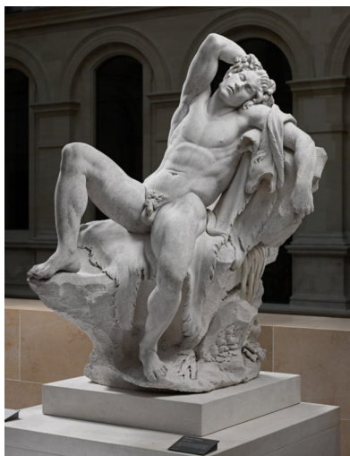
Bouchardon Edme, Faune endormi, 1726-1730

Depuis la Pyramide, dirigez-vous vers l'aile Richelieu. Après le contrôle, allez tout droit vers les salles de sculpture française. Arrivé en salle 104, tournez à droite pour atteindre la Cour Puget. Là, empruntez les trois escaliers à votre gauche pour atteindre le niveau supérieur de la cour.