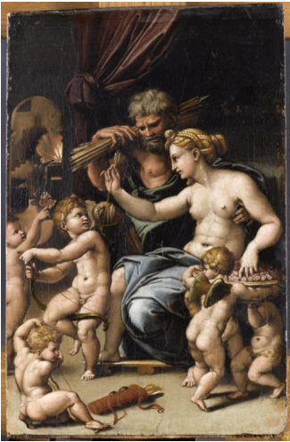
Atelier de Giulio Romano, Vénus, Vulcain et l'Amour avec cinq putti, 1 ère moitié du XVI e siècle (vers 1520-1530)