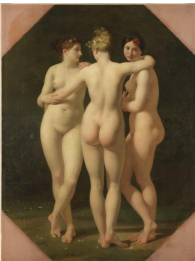
Jean Baptiste Regnault, Les trois Grâces, 1793-1794

Dans la salle suivante, Les trois Grâces sont en face de vous, à gauche de la porte.