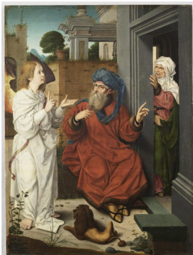
Jan Provost, L'Ange annonçant à Abraham la naissance d'un fils, XVI e siècle

Itinéraire jusqu'à la prochaine œuvre : Dirigez-vous vers la pièce suivante (817). Vous y trouverez le tableau de Jan Provost.