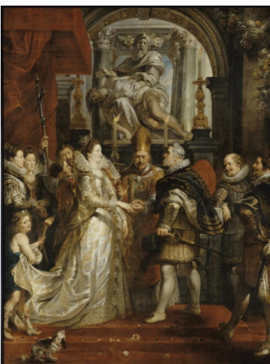
Petrus Paulus Rubens, Les Épousailles de la reine ou La Réception de l'anneau, dit encore Le Mariage par procuration de Marie de Médicis et de Henri IV, à Florence, le 5 octobre 1600, 1 er quart du XVIIe siècle (1600-1625)

Tournez le dos à l'œuvre. Dirigez-vous à droite. Continuez tout droit jusqu'à arriver en salle 802. Avancez jusqu'au milieu de la pièce puis tournez à droite. Parvenu en salle 801, dirigez-vous vers le mur à votre droite pour apercevoir Le Mariage par procuration de Marie de Médicis et de Henri IV de Rubens.