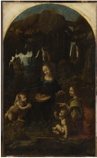
Léonard de Vinci, La Vierge aux rochers, 4 e quart du XV e siècle (1483-1499)