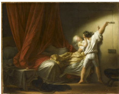
Jean-Honoré Fragonard, Le Verrou, 1777-1778 (env.)

Itinéraire jusqu'à la prochaine œuvre : Continuez dans la salle suivante. Retournez-vous, Le Verrou se situe à côté de la porte que vous venez d'emprunter.