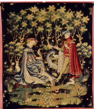
L'offrande du cœur, 1400-1410

Quittez la salle 508. Tournez à droite et continuez tout droit jusqu'à la salle 505. Là, tournez à gauche et entrez dans la salle vous faisant face. À l'entrée directement à votre droite, se trouve suspendue une dernière tapisserie, L'offrande du cœur .