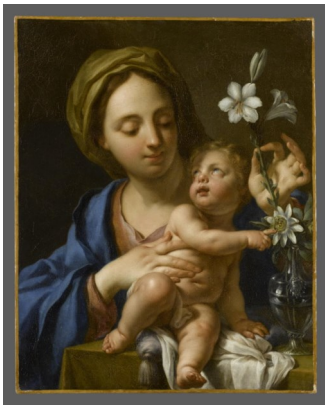
Francesco Trevisani, L'Enfant Jésus désignant à la Vierge les fleurs de la Passion , XVIII e siècle

Poursuivez jusqu'au bout de la Grande Galerie. Traversez la salle 717 puis descendez le petit escalier. Arrivé en salle 718, entrez dans le corridor de droite. L'Enfant Jésus désignant à la Vierge les fleurs de la Passion de Francesco Trevisani se trouve dans la première pièce du corridor (722).