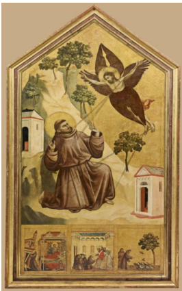
Giotto di Bondone, Saint François d'Assise recevant les stigmates, dans la prédelle: Saint François prêchant aux oiseaux, 1 er quart du XIV e siècle (1300-1325)

Revenez sur vos pas. Passez devant la Victoire de Samothrace et entrez dans la salle qui vous fait face (706). Continuez jusqu'à la salle 708. Le tableau se trouve à gauche de l'entrée.