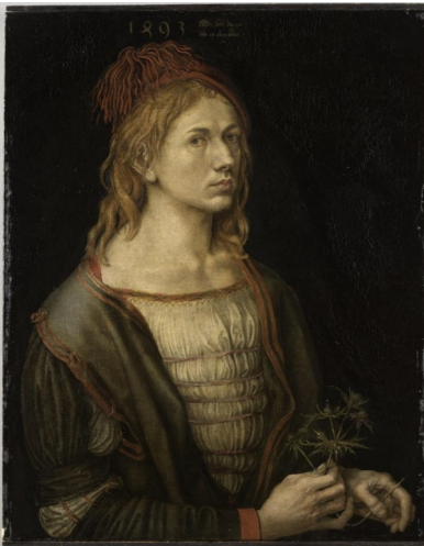
Albrecht Dürer, Portrait de l'artiste tenant un chardon, 4e quart du XVe siècle (1493)

Contournez le pan de mur face auquel vous vous trouvez. Traversez la salle 811 sans vous arrêter. Dans la salle suivante (809), vous trouverez le Portrait de l'artiste tenant un chardon d'Albrecht Dürer à votre droite.