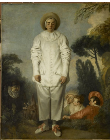
Jean-Antoine Watteau, Pierrot, 1700-1725

Au fond de la salle, montez l'escalier puis tournez à droite. Entrez dans la salle 917. Le tableau est face à vous.