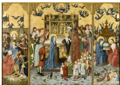
Maître de la Sainte Parenté, Retable des sept joies de la Vierge, 1470-1515

Il vous faut à présent rejoindre les escalators pour accéder au 2 e étage. Pour cela, continuez tout droit. Traversez le Grand salon (544), le Salon de Famille (543) et la salle dédiée à la collection Thiers. Tournez ensuite à droite et continuez jusqu'à sortir des appartements Napoléon III. Empruntez les escalators en direction du 2 e étage. Dirigez-vous vers l'entrée qui vous fait face (835) et traversez la pièce. Suivez la direction "Peintures. Ecoles du Nord". Vous voilà arrivé en salle 819. Le retable se trouve à votre droite.