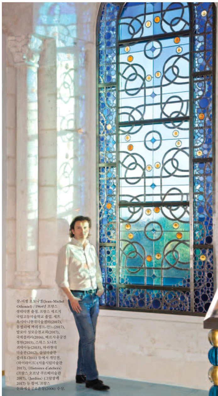
장-미셸 오토니엘(Jean-Michel Othoniel) / 1964년 프랑스 생테티엔 출생. 프랑스 세르지 국립고등미술학교 졸업, 세프 옥시타니현대미술센터(2017), 몽펠리에 까레생트-안느(2017), 발로아 성모승천교회(2017), 국제갤러리(2016), 베르사유궁전 정원(2015), 스위스 도나호 피테아눔(2015), 하라현대 미술관(2012), 삼성미술관 플러토(2011) 등에서 개인전. <하이라이트>(서울시립미술관 2017), <Histoires d'ateliers>(프랑스 오르낭 쿠르베미술관 2017), <Jardins>(그랑팔레 2017) 등 참여. 프랑스 문화예술공공훈장(2006) 수상.

프랑스 최남단의 두 소도시 세프(Sète)와 몽펠리에(Montpellier)가 모처럼 미술인들의 주목을 받았다. 프랑스의 대표적 현대미술가 장-미셸 오토니엘(Jean-Michel Othoniel)이 세프와 몽펠리에의 미술공간 두 곳에서 동시에 초대형 개인전을 개최한 것. 전시는 전 세계 미술인의 이목이 집중되는 '그랜드투어' 시즌, 카셀 도쿠멘타와 같은 날에 막을 올리며 눈길을 끌었다. 전시현장을 눈으로 확인하고 작가와 직접 대화를 나누고자 긴 여정에 올랐다. 서울에서 토요일 오전에 출발해 일요일 정오가 다 되어 작은 어촌마을 세프에 도착했다. 파스한 햇살 아래 오토니엘이 손을 흔들며 인사하는 모습이 보였다.