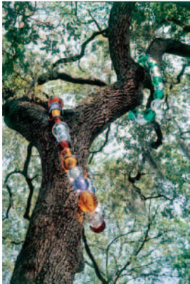
위 · (Peggy's Necklace) 유리, 금속 837×120×80cm 2006 페기구겐하임컬렉션 전시전경 아래 · (L'Arbre aux Colliers) 유리, 스테인리스 스틸 가변크기 2003 뉴올리언스미술관 전시전경 오른쪽 페이지 · (사랑의 기하학)전 전경 2017 세트 옥시타니현대미술센터

(Villa Saint Clair) 레지던시 작가로 생활했던 곳이기도 하다. 30년 만에 세프로 귀환한 작가는 젊은 시절 애착을 가졌던 재료로의 귀환도 감행했다. 바로 흑요석이다. 그는 1992년 아르메니아 화산지대를 탐사하며 직접 채취한 흑요석으로 작은 조각 <새로운 재주(Le Contrepet)>를 만들었다. 그리고 20년이 훌쩍 넘은 2015년 사람의 두상보다 훨씬 더 큰 흑요석 원석을 깎아 <볼 수 없는 얼굴들(Invisibility Faces)>을 선보인 것이다. “처음 흑요석을 만났을 때 느꼈던 미스터리를 제대로 표현하는 데까지 오랜 세월이 걸렸다. 흑요석은 뜨거운 용암에서 비롯된 강한 재료지만 동시에 깨지기 쉬운 유리라는 양가적 성질을 갖고 있다. 나는 이따금씩 스스로가 ‘거울’이라고 느낀다. 이 작업은 타인을 은근하게 비춰 보이는 검은 거울로서 나의 자화상이 된다.” 전시는 이밖에 <야행자들의 키오스크(Le Kiosque des Noctambules)>(2000), <나의 침대(Mon Lit)>(2003), <페기의 목걸이(Peggy's Necklace)>(2006) 등 기존 대표작의 아이디어 스케치 100여 점도 함께 선보였다.