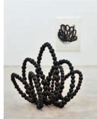
(Black Lotus) 알루미늄, 스틸 150×150×150cm 2016 국제갤러리 전시전경 왼쪽 페이지 위 · (The Big Wave) 검은 유리벽돌, 철 535×1,500×510cm 2017 세트 옥시타니현대미술센터 전시전경 아래 · (Invisibility Faces) 흑요석, 나무 가벽크기 2017 세트 옥시타니현대미술센터 전시전경

한편 오토니엘과 만나기 불과 4일 전인 지난 6월 1일 미 트럼프 대통령이 파리기후협약에서 탈퇴선언을 했다. 작가는 이 사건을 섬뜩한 경고의 메시지로 받아들인다. “세계가 점점 더 위험해질수록 영성을 추구하는 나의 작업은 더욱 더 강한 정치적 메시지를 품는다고 믿는다. 작품을 완성하고 첫 번째로 놀라는 것은 작가 자신이다. 그 결과물에서 이 세계의 현실이 묻어나기 때문이다. 세계가 변화하면서 예술작품은 세대를 향해 계속해서 변화하는 거울이 된다. 모든 세대가 예술에서 미래를 향한 각기 다른 비전을 발견하고 당대의 미스터리를 풀어낼 열쇠를 발견할 것이다. 나는 진정으로 그런 작업을 하고 싶다.”