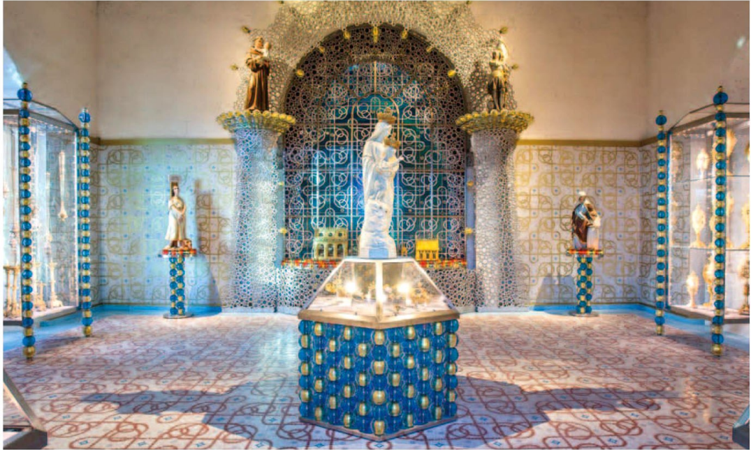
〈영광령의 보물〉전 전경 2016 세인트피에르성당 작가는 한국에서 순교한 프랑스 신부의 유물을 영구전시할 성물함 최대 테마스트리 스테인드글라스 벽지 바닥장식을 9년에 걸쳐 제작했다.

건설, 이민자유입이 가파르게 이뤄지며 변신을 거듭하고 있다. 현대미술공간 까레생트-안느(Carré Sainte-Anne) 역시 19세기 신고딕양식의 성당이었으나 현재는 공사를 거쳐 용도를 변경해 운영하고 있다. 여기서의 작가가 직접 모은 자신의 컬렉션전이 펼쳐진다. 이렇게 성격이 확연히 다른 두 전시를 하나로 묶는 제목은? 바로 '사랑에 빠진 기하학(Géométries Amoureuses)'. 그는 제목이 "관능과 규율, 상처와 아름다움과 같은 양가성에 무게를 두고 작업해온 나의 예술세계를 잘 드러낸다"고 설명한다.