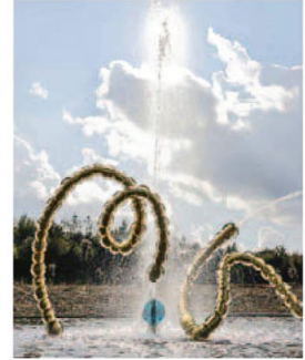
《Les Belles Danses》 2015 베르사유공전 오른쪽 · 《사랑의 기하학》전 전경 2017 프랑스 몽펠리에 까레생트-안느