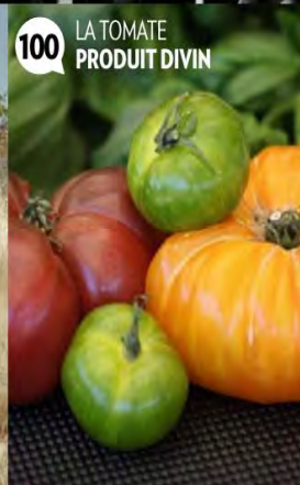
100 LA TOMATE PRODUIT DIVIN

GÉREZ VOTRE ABONNEMENT ABONNEZ-VOUS POSEZ VOS QUESTIONS Par Internet : www.parismatchabo.com Par e-mail : parismatchabonnements@cba.fr Par téléphone : (00 33) 01 75 33 70 44 Par courrier : Paris Match abonnements CS 50002 - 59718 Lille Cedex 09