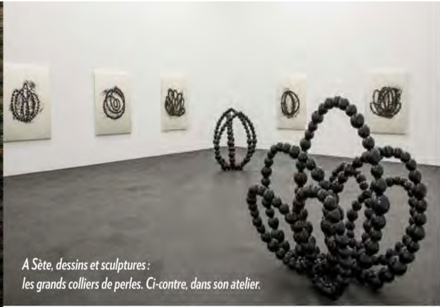
A Sète, dessins et sculptures : les grands colliers de perles. Ci-contre, dans son atelier.