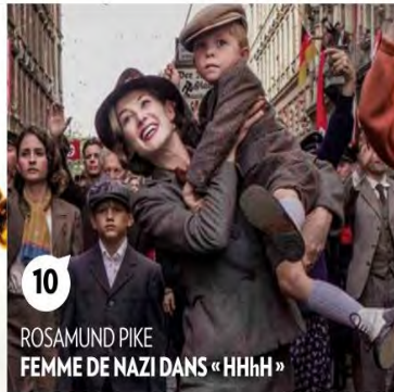
10 ROSAMUND PIKE FEMME DE NAZI DANS « HHHH »