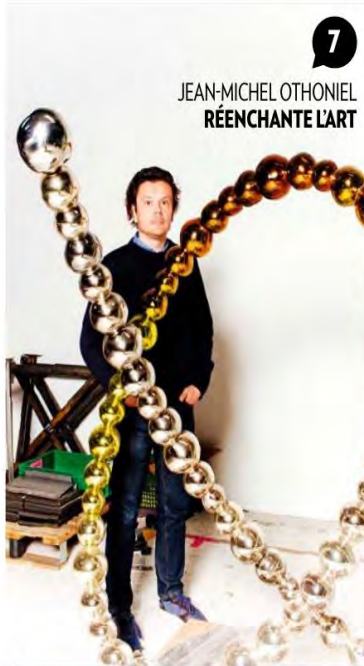
7 JEAN-MICHEL OTHONIEL RÉENCHANTE L'ART