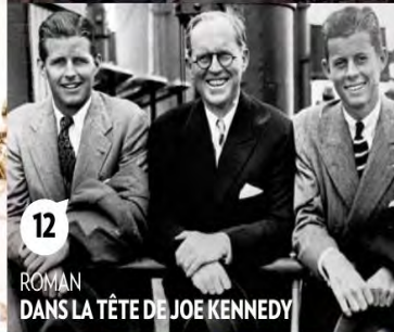
12 ROMAN DANS LA TÊTE DE JOE KENNEDY